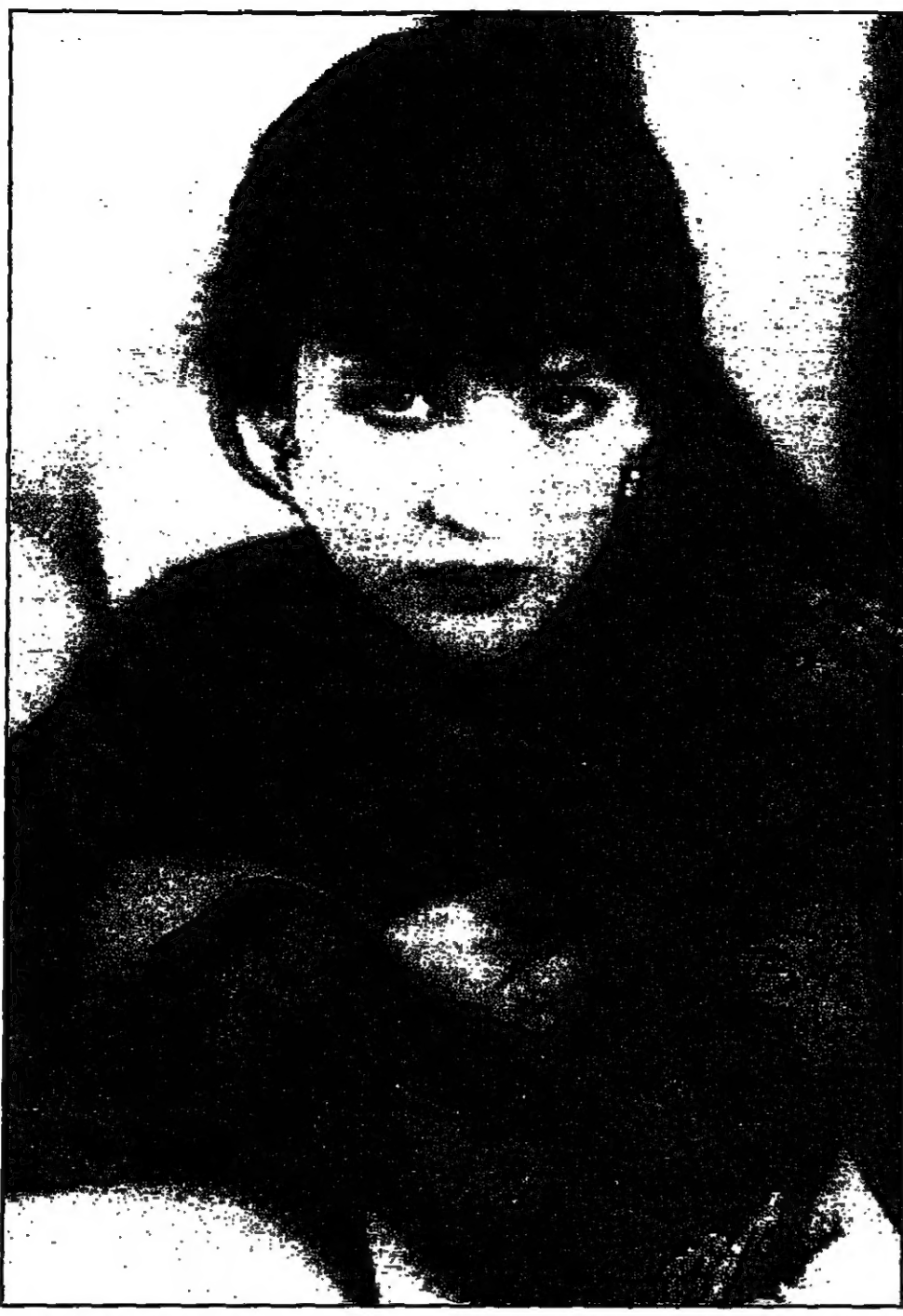
الملكة الفرنسية صوفي مارسو في صورة لها اقتطعت في نيويورك في آذار (مارس) للنسب بمناسبة الترويج لفيلمها الأخير أانا كارينينا.